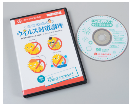
同社が販売するウイルス対策ソフト付きのDVD教材

何よりもウイルスにまつわるリスクや対策の必然性について受講者の意識を高め、各人のパソコンをウイルスの脅威からしっかりとガードするための仕組みを整えることができたことは我々にとって大きな成果であり、これまでの懸念だった教室のパソコンを媒介とするウイルス感染に向けた対策も大幅に強化できました。受講者からも、教室と自宅で同一のソフトを利用してウイルス対策が行えることの安心感や、これまで悩まされていた製品利用に関する認証手続きの煩雑さから解放されたことを評価する声が数多く届いています」