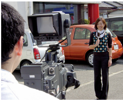
わたらせテレビの報道風景

安定していること、導入コストがリーズナブルであることを条件に数製品を試用し、比較検討しました。SpamHunterは検知率・使いやすさ・安定性の面で優れており、すぐに導入を決定しました。また、当社はISP事業者のため、利用者数が非常に多く、ユーザー数でライセンス費用を決定する製品だと、非常に高額になることが解りました。あるアプライアンス製品の導入コストは1千万円以上、ASPサービスの場合は月額3百万円もしました。一方SpamHunterはユーザー数に応じて価格が変わらないため、費用対効果が高く、当社のような業態にマッチした製品でした」