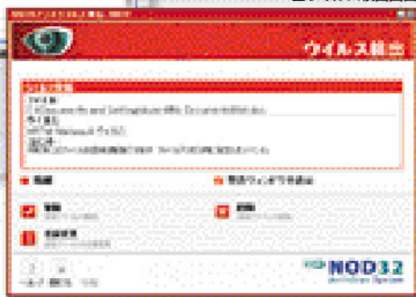
■ウイルス検出画面